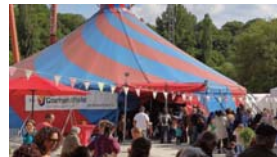
Jährlich treten die Schüler der AG „Zirkus Globulini“ (6.-8. Klassen) für eine Woche im Zirkuszelt im Enzaupark auf