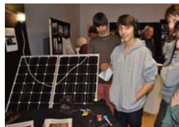
Präsentation der Halbjahresarbeiten in den 9. Klassen