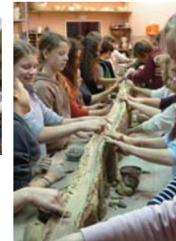
Geschichtsunterricht über das Römische Reich – Schüler der 6. Klasse rekonstruieren ein römisches Viadukt