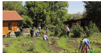
Unterrichtsfach Gartenbau: Nachhaltigkeit und Ökologie sind fester Bestandteil des Lehrplans