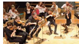
Musischer Unterricht hat an der Waldorfschule einen hohen Stellenwert